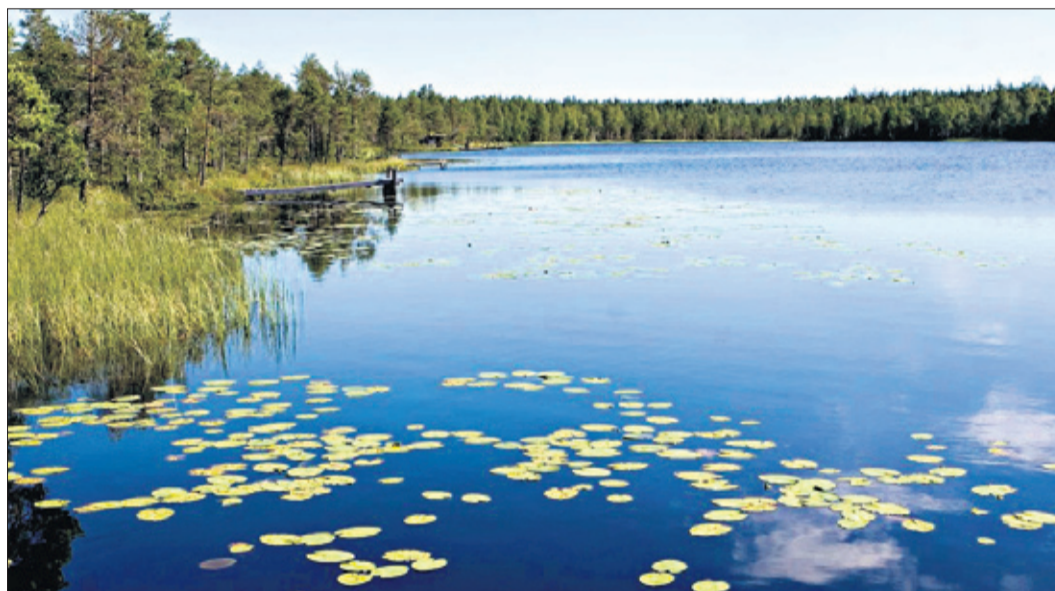
Mosavattnet är en brunvattensjö med inplanterad regnbågslax.

finska och engelska. Den är försedd med karta där de olika sevärheterna finns utritade samt